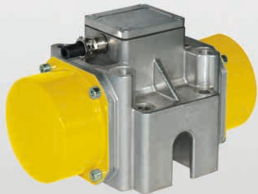
EV 54: Normal- und Hochfrequenz-Außenrüttler für Standardanwendungen in der Schüttgut- und Betonindustrie